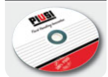
See "Fluid monitoring" section