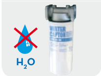
(only column versions)