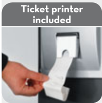
Ticket printer included